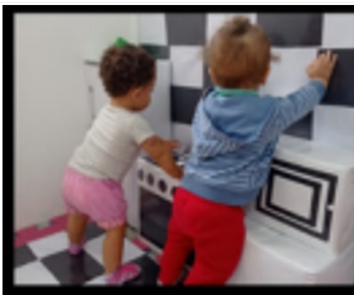
Explorando o cantinho simbólico.