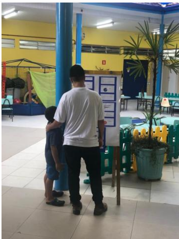
Responsável olhando o resultado da pesquisa de satisfação.