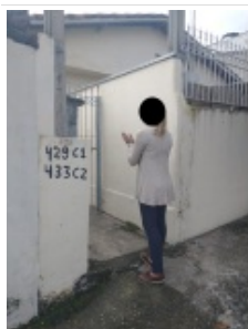
Busca ativa ( Visita a residência)