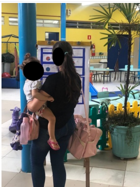
Responsável observando o resultado da pesquisa de satisfação.1