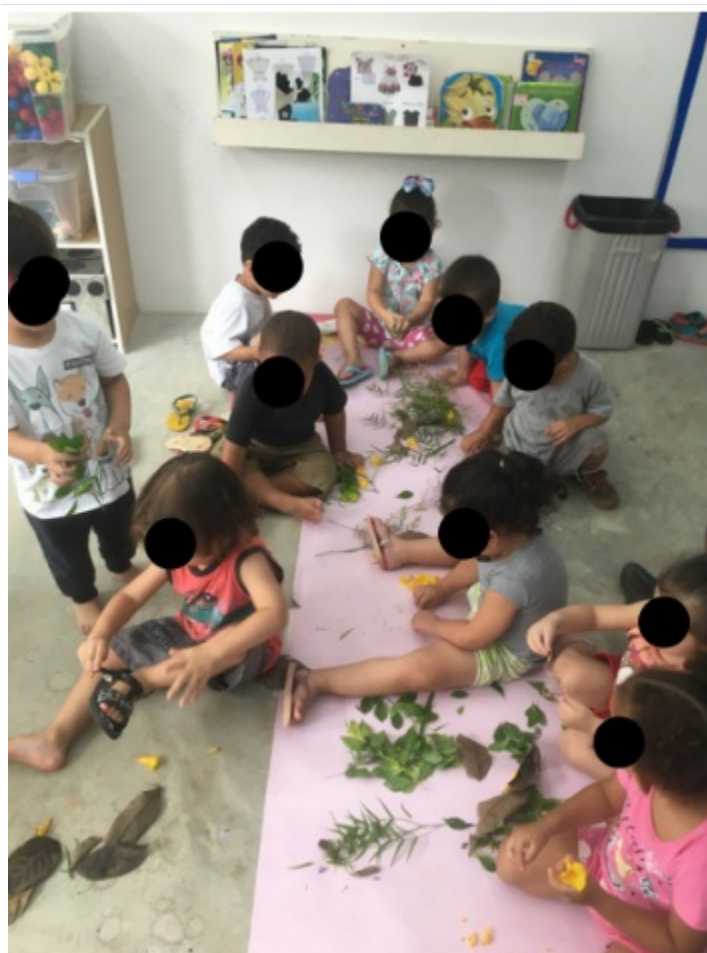
Explorando as folhas das árvores que tem na escola.