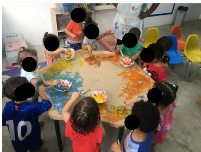
Descobrimo novas cores ..